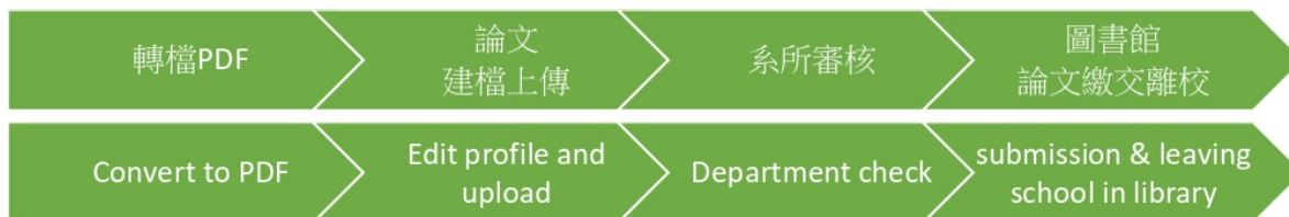
東華大學圖書資訊處論文建檔繳交流程圖 thesis/dissertation upload and submission flow chart